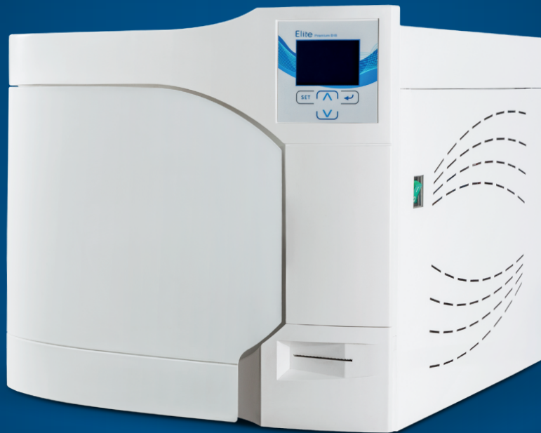
Elite Premium B18/24

کیفیت و تکنولوژی پیشرفته کلیه نیازهای مورد نظر شما را تامین می کند