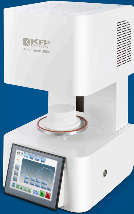
Auto Therm 3000

QUALITY & ADVANCED TECHNOLOGY PROVIDE FULL FACILITIES AS YOU DESIRED